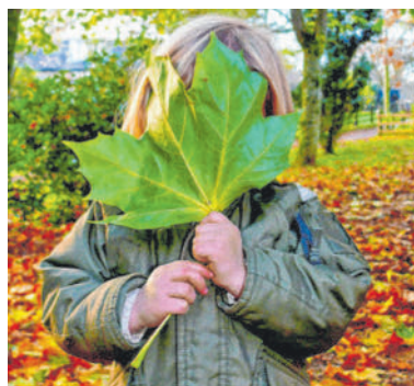
Alle Vorträge der Reihe „Wertvolle Kinder“ des Vorarlberger Kinderdorfs sind kostenlos.