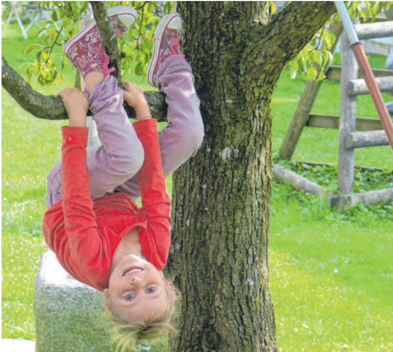
Kinder brauchen sichere, vertrauensvolle Beziehungen – gerade dann, wenn Konflikte den Alltag auf den Kopf stellen.

Freundin schnappen, am Freitag, 18. November, zwischen 14 und 19.30 Uhr in den Pfarrsaal Mariahilf in Bregenz (Mariahilfstraße 52) kommen und beim Tag der offenen Tür von „Déesse Kosmetik“ dabei sein. Das komplette Déesse-Sortiment zum Schnuppern und Probieren, Schminktipp, Geschenksideen, viele Aktionen, Prosecco und vieles mehr erwartet die BesucherInnen.